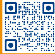
Philips HearLink 2 App

Die Philips HearLink App ist das ideale Tool für die Bedienung der HearLink Hörgeräte: Mit ihr steuert man die Lautstärke, ändert das Hörprogramm, findet die Hörgeräte wieder, prüft den Ladezustand des Akkus und justiert die Einstellungen beim Soundstreaming.