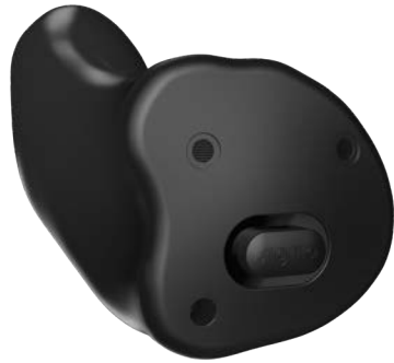
Insio Charge&amp;Go AX