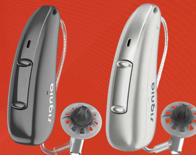
Pure Charge&Go AX

Einzigartig! Das erste maßgefertigte Signia Im-Ohr-Hörgerät mit Akku ist da: Insio Charge&Go AX. Es kommt ohne sichtbare Ladekontakte aus, sodass es mit seinem attraktiven und modernen Design alle Zielgruppen begeistert. Seine einzigartige MR-Ladetechnologie ermöglicht kontaktloses Laden bei unterschiedlichen Formfaktoren.