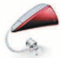
Delta mit Delta-Otoplastik

Für die Kundengruppe, die ihr Hörproblem im Verhältnis zum Preis für zu gering empfanden, kommt das neue Delta 4000 auf den Markt, das im Bereich der Mittelklasse angesiedelt sein wird. Somit entfallen auch die ökonomischen Begrenzungen für Delta und man kann sagen, dass der Slogan „Delta für Alle“ tatsächlich seine Berechtigung hat.