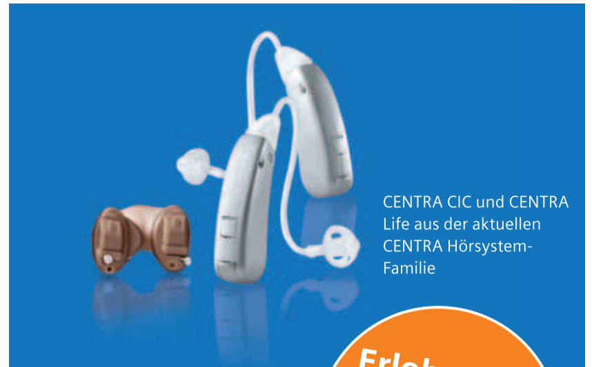
CENTRA CIC und CENTRA Life aus der aktuellen CENTRA Hörsystem-Familie

Das Konzept garantiert also nicht nur eine schnellere Abwicklung des Bestellvorgangs, sondern verbessert auch die Qualität der Im-Ohr-Hörsysteme. Damit sparen Sie wertvolle Zeit und erhöhen die Zufriedenheit Ihrer IdO-Kunden. Lassen Sie sich am Siemens-Stand alle Facetten des „IdO-Konzeptes der Zukunft“ erläutern. Sie werden beeindruckt sein.